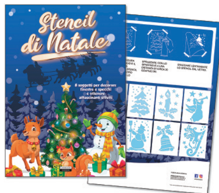
STENCIL DI NATALE 8 SOGGETTI f.to 21x29,7 cm - pag. 16