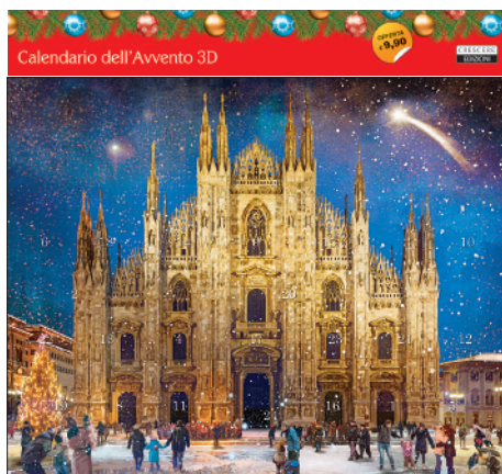
DUOMO DI MILANO 9788883379758