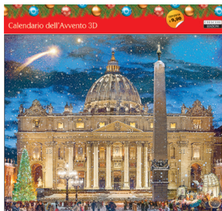
BASILICA DI SAN PIETRO ROMA 9788883379765