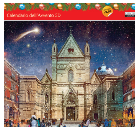
SAN GENNARO (DUOMO DI NAPOLI) 9788883379772